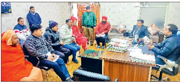
यमुनानगर के निगम कार्यालय में गोशाला प्रबंधकों व अधिकारियों की बैठक लेते निगम आयुक्त आयुष सिन्हा।

मंगलवार को नगर निगम आयुक्त आयुष सिन्हा ने गोशाला प्रबंधकों व पशुपालन विभाग के अधिकारियों की बैठक ली। बैठक के दौरान निगम आयुक्त आयुष सिन्हा ने गोशाला प्रबंधकों को निर्देश दिए कि निगम द्वारा पकड़कर गोशालाओं में छोड़े जा रहे बेसहारा