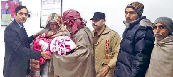
हरिभूमि न्यूज फतेहाबाद

उपायुक्त एवं जिला रेडक्रॉस सोसायटी के अध्यक्ष अजय सिंह तोमर ने मंगलवार को उपायुक्त कार्यालय में गरीब एवं जरूरतमंद व्यक्तियों को कंबल वितरित किए। इस मौके पर उपायुक्त ने कहा कि ठंड को ध्यान में रखते हुए जिला रेडक्रॉस सोसायटी द्वारा समय-समय पर गरीब एवं जरूरतमंद व्यक्तियों को कंबल वितरित किए जाते हैं, जिससे गरीब, असहाय एवं जरूरतमंद व्यक्तियों की जान ठंड