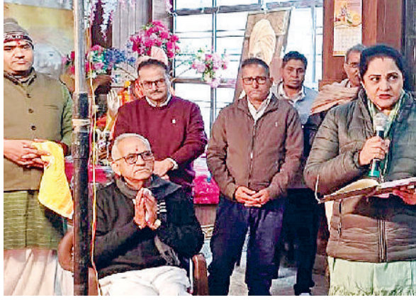
फतेहाबाद। श्री सनातन धर्म मंदिर में आयोजित कार्यक्रम को संबोधित करते सांसद सुनीता दुग्गल।