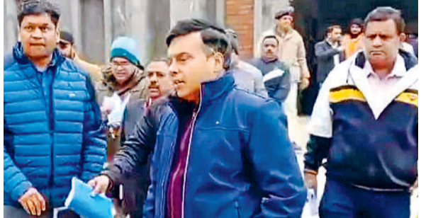
सिरसा। रेलवे स्टेशन का निरीक्षण करते हुए डीआरएम बीकानेर।

अमृत भारत योजना के तहत डबवाली रेलवे स्टेशन का कायाकल्प हो रहा है। रेलवे स्टेशन की नई व्यवस्थाएं व यहां चल रहे कार्यों का निरीक्षण करने के लिए बीकानेर डिवीजन के डीआरएम आशीष कुमार के नेतृत्व में एक टीम