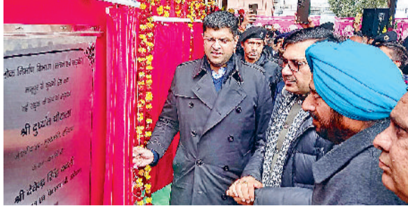
टोहना। विकास कार्यों का उद्घाटन करते उपमुख्यमंत्री दुष्यंत चौटाला, साथ में हैं पंचायत मंत्री देवेन्द्र सिंह बबली।

हरियाणा के उपमुख्यमंत्री दुष्यंत चौटाला ने कहा है कि प्रदेश सरकार एक मजबूत व्यवस्था बनाकर गांवों का शहरों की तर्ज पर विकास करवा रही है। गांवों के आधारभूत ढांचे के विकास के लिए अनेक परियोजनाएं लागू की हैं। प्रदेश के 108 गांवों में सीवरेज प्रणाली विकसित की जा रही है और गांवों में एसटीपी का निर्माण किया जा रहा है। उपमुख्यमंत्री दुष्यंत चौटाला मंगलवार को टोहना विधानसभा क्षेत्र के गांव पिरथला में जनसभा को संबोधित कर रहे थे। इस अवसर पर उपमुख्यमंत्री ने डिजिटल लाइब्रेरी का उद्घाटन भी किया। उपमुख्यमंत्री ने टोहना विधानसभा क्षेत्र के 174 करोड़ 61 लाख रुपये की विकास परियोजनाओं के उद्घाटन और शिलान्यास भी किए। जनसभा को संबोधित करते हुए उपमुख्यमंत्री ने कहा कि प्रदेश की गठबंधन सरकार ने एक नई