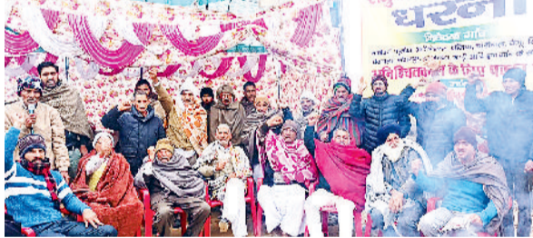
सिरसा। मेजर नहर से डेरा के लिए मंजूर किए गए मोघे का धरना देकर विरोध जताते विभिन्न गांवों के किसान।

सिरसा मेजर नहर से पब्लिक हेल्थ विभाग की ओर से पास किए गए मोघे के विरोध में दर्जनों गांवों के ग्रामीणों द्वारा संयुक्त किसान मोर्चा के नेतृत्व में दिया जा रहा धरना मंगलवार को भी जारी रहा। साथ ही किसानों ने चेतावनी दी कि यदि शीघ्र ही इस मामले का प्रशासन ने हल नहीं किया तो वे जिला मुख्यालय पर पड़व डालेंगे। ग्रामीणों ने बताया कि इस मोघे के प्राणियों से प्रधान बाजेका, फूलका, अलीमोहम्मद, नेजिया, चाडीवाल, बेगू, सिकंदरपुर, वैदवाला,