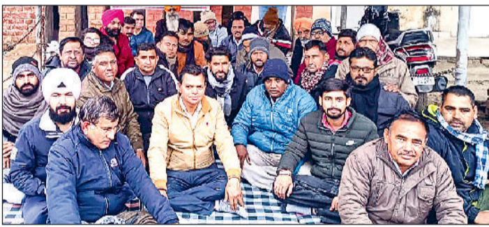
सिरसा। बैठक में भाग लेते बिजली कर्मचारी।